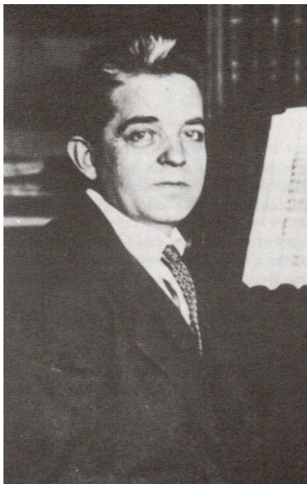
Nielsens fotografiert an einem Klavier, 1905.